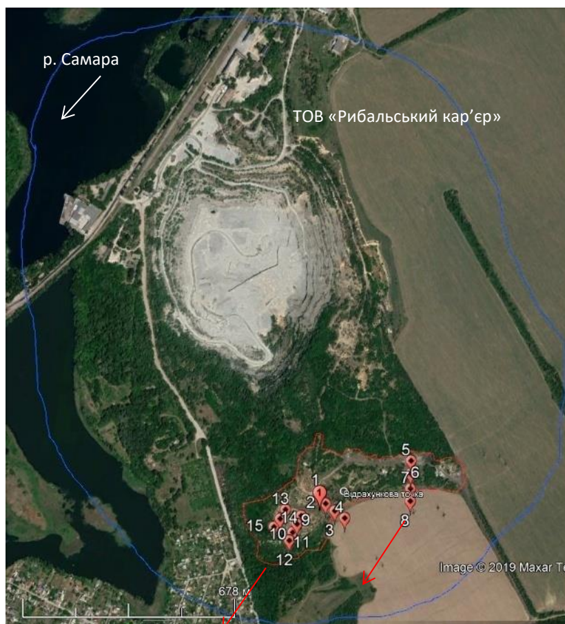
Рис. 1. Оглядова карта місцезрештування південної частини відвалів розкритих порід ТОВ «Рибальський кар'єр». Умовні позначення: Синя лінія – санітарно-захисна зона навколо підприємства за даними [19]; 1-15 – нумерація відібраних зразків ґрунту; червона лінія – контур тіла відвалу; червоні стрілочки – переважаний напрямок вітру

З поверхні відвалів, біля підніжжя та на прилеглих сільськогосподарських угіддях було відібрано 15 проб ґрунтів (рис. 1). У польових умовах проби ґрунту попередньо зважувались, а потім пронумеровані, щільно закриті кришкою бюкси того ж дня були відправлені до лабораторії Дніпровського державного аграрно-економічного університету. Відбирання, упакування і транспортування зразків ґрунту до лабораторії для подальшого визначення фізичних властивостей ґрунтів проводилося згідно до діючого стандарту ДСТУ Б В.2.1–8–2001 «Основи та підвалини будинків і споруд. Ґрунти. Відбирання, упакування, транспортування і зберігання зразків».