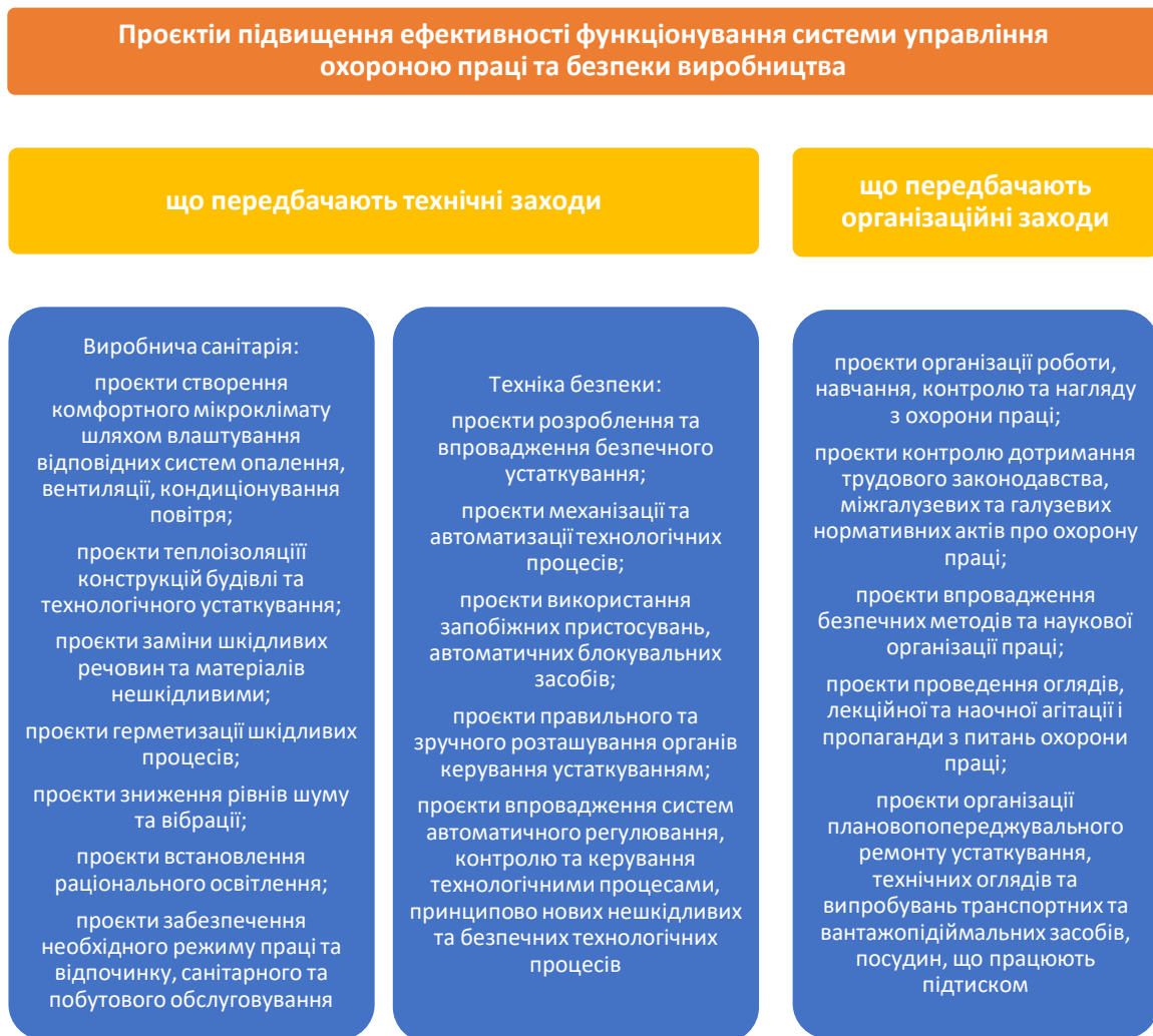
Рис. 2. Напрями проєктів підвищення ефективності функціонування системи управління охороною праці та безпеки виробництва у розрізі заходів щодо профілактики та усунення причин виробничого травматизму і професійних захворювань (запропоновано авторами на підставі матеріалів [5–15])

Серед проєктів з безпеки виробничих процесів рекомендовано зосередитися на таких, як: