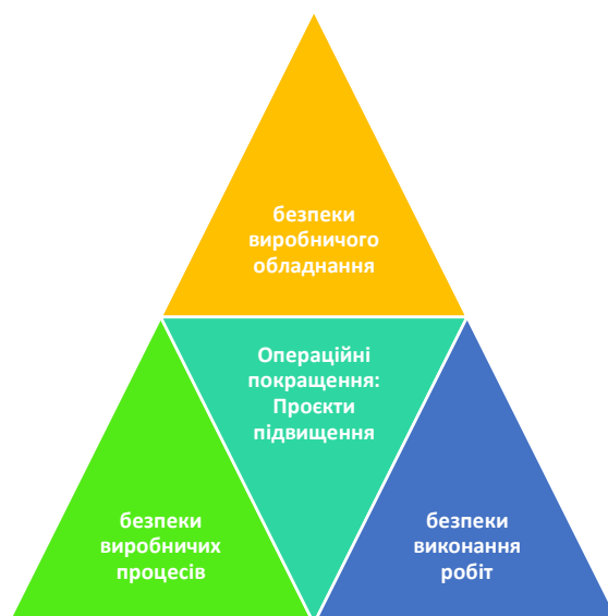
Рис. 3. Альтернативні напрямки розробки проєктів підвищення ефективності функціонування системи управління охороною праці та безпеки виробництва (запропоновано авторами на підставі матеріалів [5-15])

проєкти забезпечення пожежної і вибухової безпеки тощо.