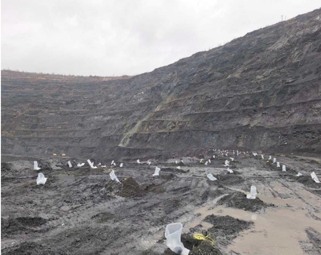
Рисунок 2.1 – Внутрішня гідрозабійка свердловин перед проведенням масового вибуху

яка перешкоджає поширенню пилогазової хмари за межі кар'єру. Монтаж систем гідрозабійки виконується спеціалізованими працівниками буропідривної ділянки відповідно до проекту масового вибуху та схеми розташування свердловин [12].