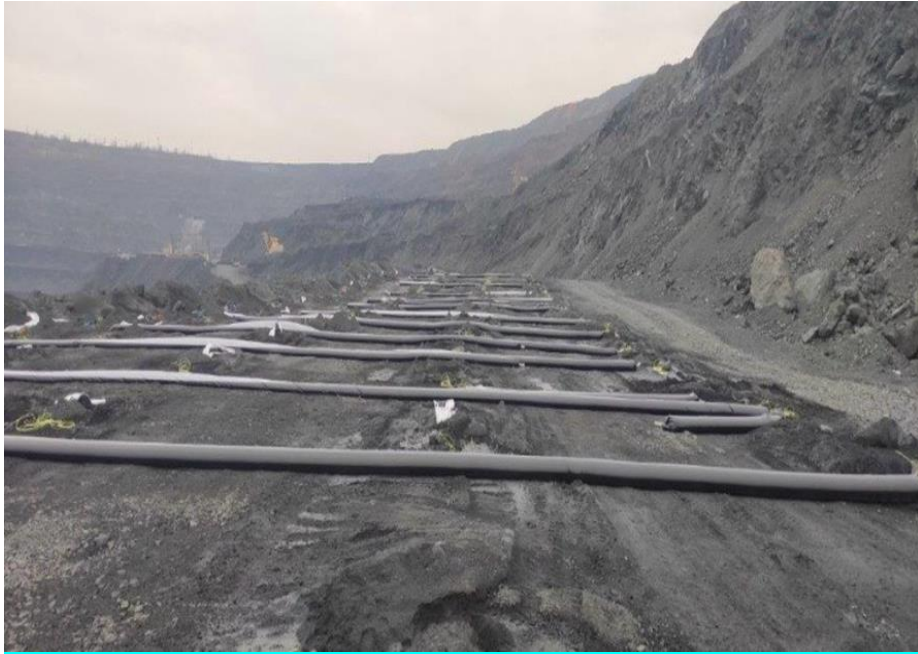
Рисунок 2.2 – Зовнішня гідрозабійка вибухового блоку із застосуванням рукавів

На рис. 2.3 наведено один із можливих варіантів реалізації системи зовнішньої гідрозабійки із застосуванням гуматового реагенту під час проведення масового вибуху [30].