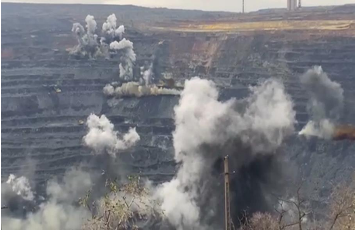
Рисунок 1.2 – Поширення пилогазової хмари після вибухових робіт

Після вибуху пилогазова хмара піднімається та переміщується під дією повітряних потоків. На початковому етапі переважає вертикальний рух, зумовлений високою температурою газоподібних продуктів вибуху, які піднімають пил на значну висоту [16].