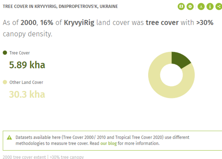
2000 tree cover extent | >30% tree canopy

Дані Global Forest Watch свідчать, що у 2020 році природні ліси Кривого Рогу Дніпропетровської області займали площу близько 2150 га, що становило 6,0 % території міста. У 2023 році зафіксовано втрату 4 га природного лісу, що еквівалентно 2,09 тис. тонн викидів CO 2 . Для порівняння: станом на 2000 рік частка деревного покриву з щільністю крони понад 30 % становила 16 % (5890 га) від загальної площі міста (рис. 1, а). У період з 2001 по 2023 рр. лісові насадження Кривого Рогу забезпечували чисте поглинання вуглецю на рівні -49,7 тис. тон CO 2 е/рік (рис. 1, б) [2].