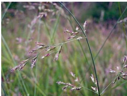
Рисунок 3.7 – Вівсяниця – костриця лучна

Має мичкувату кореневу систему, але інколи коріння можуть заглиблюватися в ґрунт на глибину 1,5 м. Рослина висаджується на весні або восени, чудово переносить морози. Перші сходження після осіннього посіву з'являться під час відлиги, тому вважається кращим часом для посіву осінь. Глибина посіву складає 2 – 3 см, в середньому 20 – 25 кг/га. Якщо добре підгодовувати рослину добривами, то рослина може розвиватися і рости на одному місці до 15 років.