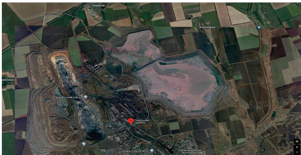
Рисунок 2.1 – Місце розташування ПРАТ «ПІВНГЗК»

ПРАТ «ПІВНГЗК» [24] розташоване у північній частині міста Кривий Ріг Дніпропетровської області (рис. 2.1) та вважається одним з найбільших гірничодобувних підприємств Європи, виробнича діяльність якого складається з повного циклу: від видобутку залізної руди, до підготовки доменної сировини – залізородного концентрату, обкотишів.