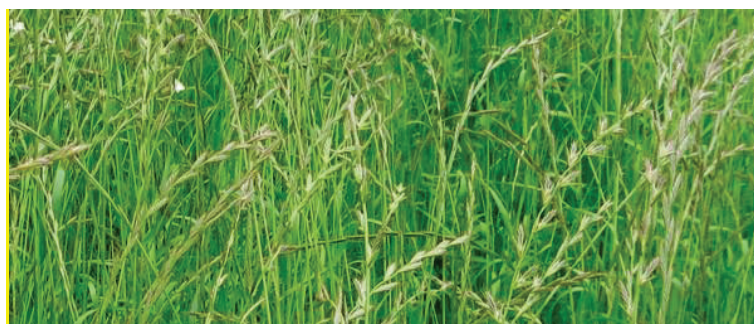
Рисунок 3.8. – Райграс однорічний

Райграс однорічний – однорічна злакова трава (рис. 3.8). Має розвинену мочкувату систему, проникність у ґрунт до 95 см. Має прямо-стояче тонке стебло висотою 60-100 см та створює навколо себе куц з пасинків. Якщо посів відбувся густо, то куц складе 8-10 шт., при рідкому посіві 30-40 шт., які в свою чергу дадуть велику кількість насіння.