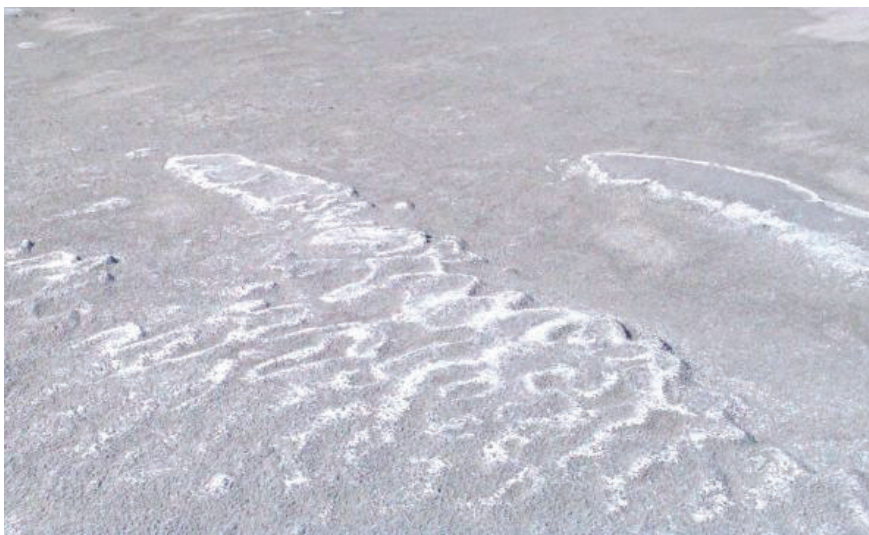
Рисунок 3.2 – Утворення сольових виступів на поверхні сухого пляжу хвостосховища, закріпленої бішофітом [16]

наявності вітру призвело до виносу пилу. Також під час підвищення температури повітря вологість необроблених ділянок знижується на 20% внаслідок випаровування з поверхні та склала 3,6 % вологи, що у значно менше у порівнянні з даними обробленої бішофітом ділянки – вологість сягає 11 % і більше. Через деякий час на даних ділянках після висихання розчину утворилася солонка кірка (рис. 3.2) [16], котра перешкоджає здування пилу.