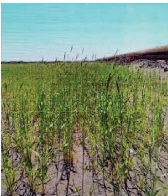
Рисунок 3.12 – Кінцевий стан посівів жита на карті хвостосховища

глибина проникнення коріння у субстраті склала 10 – 15 см. В третій декаді вересня була виконана підкормка сходів насіння мінеральними добривами аміачною селітрою. Причиною додаткового внесення добрив стало багато опадів у осінній період, що могло спричинити вимивання NPK та споживання рослинами мікроелементів більш інтенсивно, аніж було заплановано. При проведенні моніторингу на хвостосховищі на картах, де було проведено закріплення житом, показник пиління зменшення на 85 – 90%.