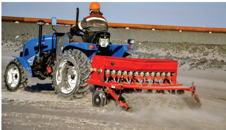
Рисунок 3.4 – Рихлення хвостосховища перед посадкою рослин

Також перед виконанням посадки рослин необхідно виконати польові роботи та перед посівний обробіток землі. Для розпушення верхнього шару землі, вирівнюється поверхня карти і таким чином створюються сприятливі умови для посівної компанії, для сходження посівів. Проведено рихлення поверхні пляжу дисковою бороною за допомогою міні-трактора на глибину 8 – 10 см (рис. 3.4).