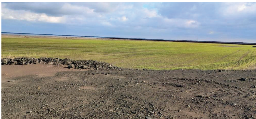
Рисунок 3.12 – Сходження жита 30.11.2023р.

Озиме жито непримхлива до ґрунту і погодних умов. Посіяні зерна починають проростати при температурі 1-2°C, а сходи з'являються на поверхні ґрунту при температурі 4-5°C. Для розвитку рослин загальна ефективна температура від проростання до припинення осінньої вегетації повинна становити 400-500°. Для всього циклу розвитку ранньостиглих сортів потрібно 1000-1700°, середньостиглих – 1200-1800°, пізньостиглих – 1300-1900°. Жито-найбільш морозостійка культура з озимих культур. Добре розвинені рослини здатні витримувати зниження температури від -20 до -25°C. Взимку без снігу вона легко переносить морози до -25°C, а при гарному загартуванні їй не шкодить зниження температури повітря до -35°C. Озиме жито починає найшвидше весняне відростання серед зернових культур, вже при температурі +2-3°C. В середньому ці культури споживають 6-8 мм вологості ґрунту і 1кг зерна рослини цих культур володіють високою холодостійкістю, посухостійкістю і здатністю поглинати фосфору важкодоступних формах з ґрунту.