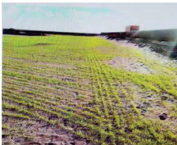
Рисунок 3.10 – Проростання насіння жита

Сходження культур склало 74%. що добре видно на (рис. 3.10). У весняний період рослини продовжили розвиватися утворюючи зелений покрив, що сприяло запобіганню пиління карт хвостосховища.