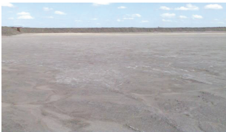
Рисунок 3.1 – Сухий пляж оброблений бішофітом

У 2008 році було проведено закріплення поверхні хвостосховища ПРАТ «ПІВНГЗК» розчином природного бішофіту (рис. 3.1).