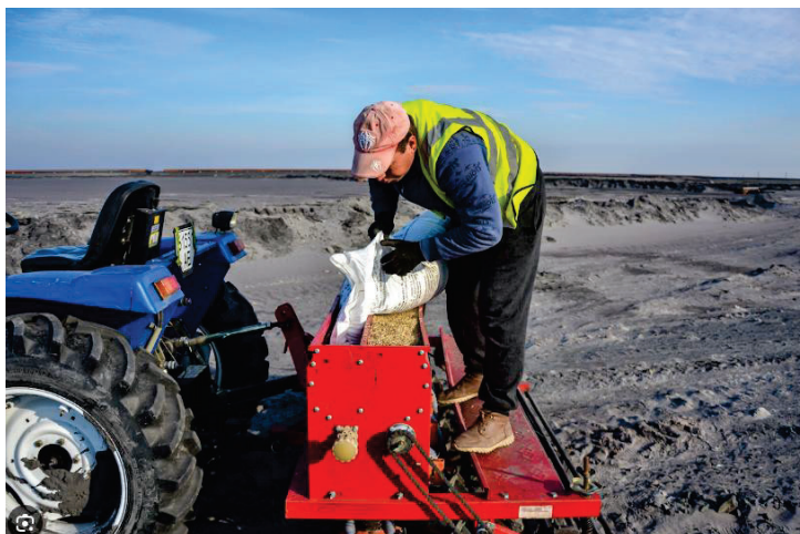
Рисунок 3.9 – Посів жита на хвостосховищі

Сходження культур склало 74%. що добре видно на (рис. 3.10). У весняний період рослини продовжили розвиватися утворюючи зелений покрив, що сприяло запобіганню пиління карт хвостосховища.