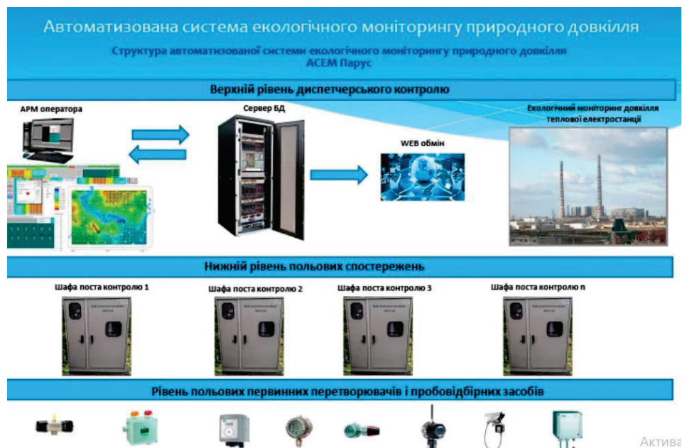
Рисунок 2.2 – Система АСЕМ Парус [20]

Як приклад наведено АСЕМ Парус (рис. 2.2) [20].