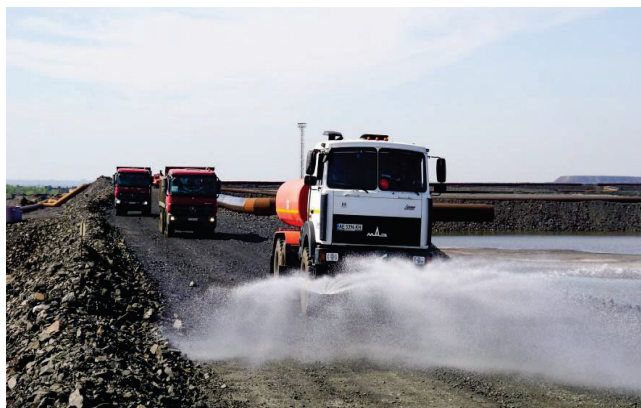
Рисунок 3.3 – Машина поливальна на базі автомобіля МАЗ

Для зниження пиління поверхонь експлуатаційних та службових доріг під час будівництва та експлуатації здійснюють полив доріг автотранспортом з використанням технічної води із системи оборотного водопостачання. Автотранспорт використовує обладнання типу струменевого гідранту. Під напором струменя пил відривається від поверхні авто полотна і осідає вже у вигляді краплинок води. Також використовують пасивний спосіб боротьби, який полягає у створенні водяної завіси, або розпилення води із стаціонарних установок, які мають постійну або короткочасну дію. Автодороги хвостосховища за своєю конструктивною особливістю потребують постійного зволоження. При необробленій дорозі у суху погоду при вітрі більше 3 м/с, інтенсивність перенесення пилу сягає 10 000-11 000 мг/с. Полив доріг зазвичай виконують за допомогою цистерни, яку розташовують на вантажних автомобілях (рис. 3.3).