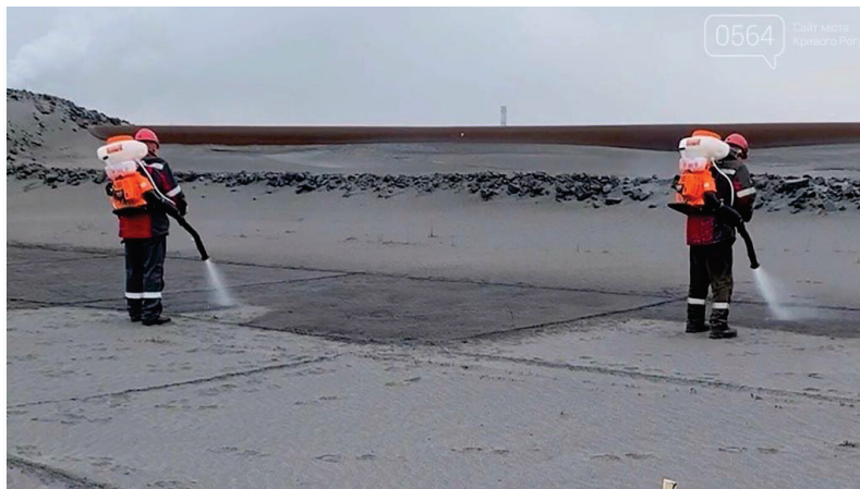
Рисунок 3.14 – Розпилення хімічного реагенту на хвостосховищі

безпеки обов'язково користуватися респіраторами, хімічними костюмом та рукавичками (рис. 3.14).