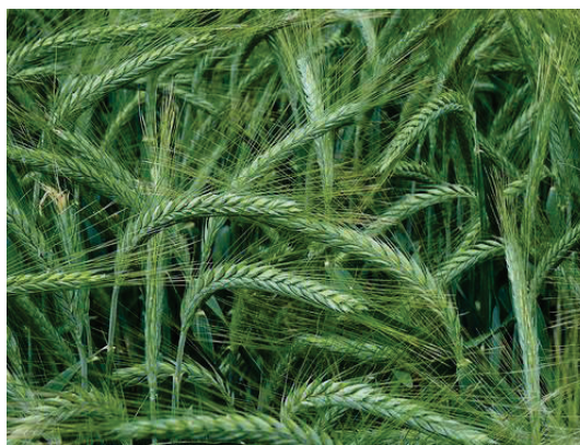
Рисунок 3.13 – Тритикал (Triticale)

Для рекомендації був обраний гібрид пшениці і жита так заний тритикал (Triticale) (рис. 3.13). Вони мають добре розвинену кореневу мичкувата, систему, яка глибоко проникає в шлам хвостосховища. Має стійкі до грибкових і вірусних захворювань. Відрізняється високою фізіологічною активністю, що сприяє гарному розвитку рослин на малородючих ґрунтах, в тому числі на шламах хвостосховищ. Зерна цієї культури більші, ніж у жита, і під час проростання вони можуть довше використовувати поживні речовини та восени утворюються більші рослини.