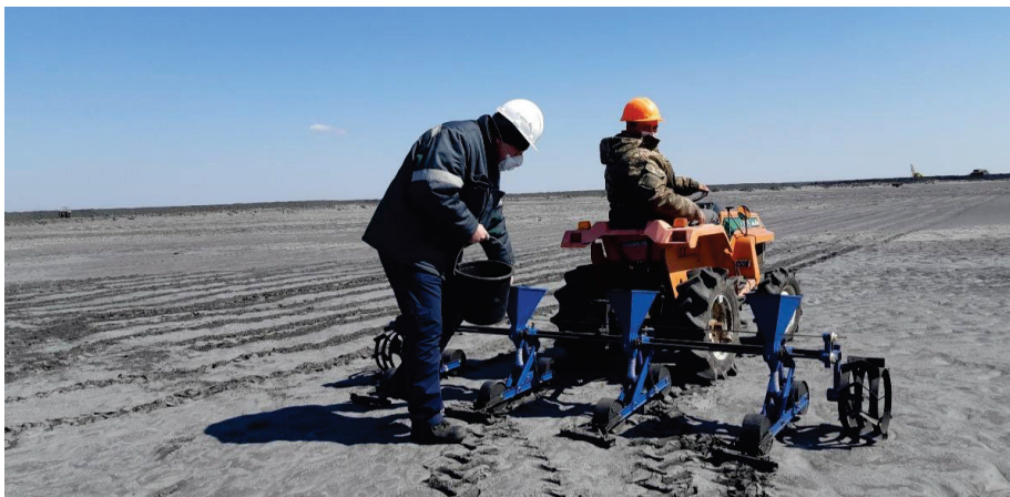
Рисунок 3.5 – Посів кураю іберійського на хвостосховищі ПРАТ «ПІВНГЗК» [29]

3.6) [29]. Причиною могло стати не правильний вибір різновиду з існуючих понад 100 видів кураю іберійського, а також погодні умови період усього росту рослин.