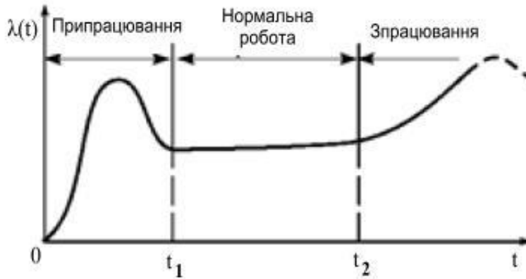
Рис. 3. Зміна інтенсивності відмов з плином часу

Графік функції \lambda(t) для циклу роботи однотипних об'єктів приведено на рис. 3.