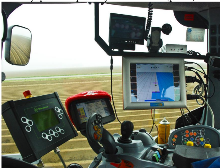
Рис. 4. Системи управління розміщені в кабіні

Всі ці системи автоматизації включають в себе наступні типові елементи: датчики, елементи арматури, перетворювач, засоби відображення інформації, які конструктивно об'єднані в пульти управління та виконавчі органи. Датчики систем першої групи встановлюються на трактор, а датчики систем другої групи - на верстати або інструменти (навісні або причіпні). Виконавчі механізми систем автоматики встановлюються на відповідні вузли трактора, а пульти управління або управління розміщуються в кабіні (рис. 4).