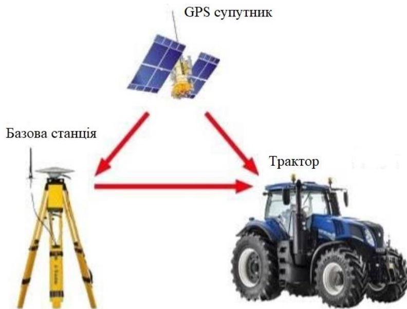
Рис.2. Структура системи точного землеробства

Точне землеробство - це сукупність технологій, технічних засобів і методів прийняття рішень, спрямованих на управління дослідницькими параметрами, що впливають на ріст рослин. Параметрами можуть бути вміст органіки і поживних речовин в ґрунті, рельєфі, наявності вологи в ґрунті, прополювати бур'яни. Точне землеробство – це нова система управління сільським господарством. Вона заснована на отриманні принципово іншої інформації в порівнянні з тим, що було раніше. Для цього використовується геостатистична методологія. А для накопичення, зберігання і використання інформації - інформаційні системи (рис. 2).