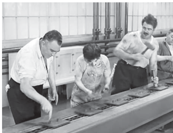
Фото 1. Сцена затягування болтів

На першому етапі підбираємо для перегляду декілька метафоричних фрагментів трудової діяльності Маленького Бродяги на заводі. Найдоречнішим з них є сцена затягування болтів, що спричиняє до різні непорозуміння з колегами та збої в роботі (фото 1).