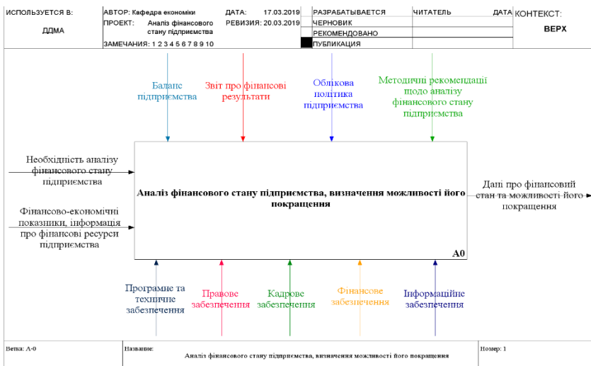
Рис. 1. Контекстна діаграма SADT - моделі процедури оцінювання фінансового стану підприємства (рівня A-0) (авторська розробка)

Після перетворення функціонального елемента «ВХІД» (показується стрілками з лівої сторони функціонального блоку) при дії елементів «МЕХАНІЗМИ УПРАВЛІННЯ» (стрілки зверху функціонального блоку) за допомогою наявних елементів «МЕХАНІЗМИ ЗАБЕЗПЕЧЕННЯ» (стрілки знизу функціонального блоку показують необхідні ресурси) отримуємо елемент «РЕЗУЛЬТАТ» (стрілки праворуч функціонального блоку), тобто в результаті побудови діаграми (рис. 1) формулюється висновок про існуюче фінансове положення підприємства (визначається тип його фінансової стійкості, виявляються втрачені можливості збільшення прибутку підприємства і причини утворення збитків), а також визначаються усі існуючі ризики та проблеми на підприємстві та можливості їх вирішення для покращення фінансового стану та сталості розвитку.